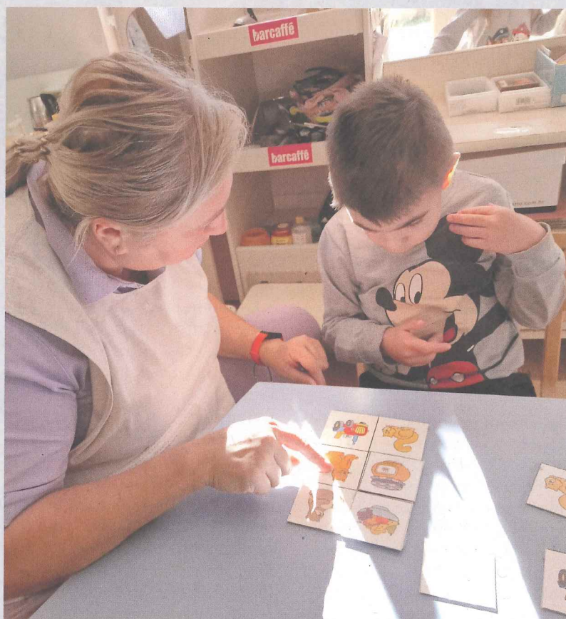
Učenje i usvajanje simbola za lakšu komunikaciju

Neovisno o tome ima li dijete teškoće u razvoju ili ne, sva djeca trebaju imati jednaka prava, pa i pravo na rani i predškolski odgoj i obrazovanje.