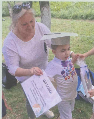
Podjela 'diploma' na završnoj priredbi

Od iznimne je važnosti da pomoćnik kao podrška djetetu s razvojnim teškoćama u vrtiću zna svoje zadaće, ali i da su te zadaće jasne i odgajatelju u skupini. Sam proces i kvaliteta procesa uključivanja pomoćnika u rad skupine uvelike ovisi o tome kakav je stav prema spomenutom procesu zauzeo odgajatelj. Pozitivan stav, kako odgajatelja, tako i ostalih stručnih djelatnika u vrtiću, puno znači i pozitivno utječe na rad pomoćnika, a time i izravno na djetetov sveobuhvatni razvoj. Iako su nedavne izmjene Zakona o predškolskom odgoju i obrazovanju prvi put uvele pomoćnike u rad vrtića, još uvijek nije donesen pravilnik kojim bi se propisao način uključivanja te način i sadržaj osposobljavanja i obavljanja poslova pomoćnika za djecu s teškoćama u razvoju. Vrtići su tu ostavljeni sami da se organiziraju i osiguraju stručnu podršku radu pomoćnika, kao i da odgovore na pitanje za koju djecu i u kojem opsegu osigurati podršku pomoćnika. Zakonska regulativa je dobrodošao korak prema propisivanju uvjeta radnog mjesta pomoćnika za djecu s teškoćama, koje u svakom slučaju predstavlja dobrodošlu pomoć djeci, odgajateljima i roditeljima djece s teškoćama te vrtićima u cjelini.